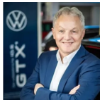
Verkäufer VW Nutzfahrzeuge / GW